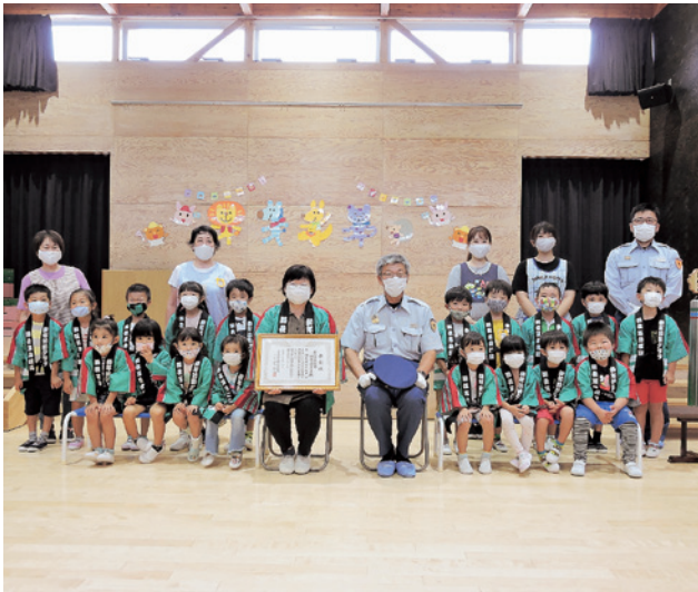
優良幼年消防クラブ 「鶉住居幼稚園幼年消防クラブ (釜石市)」