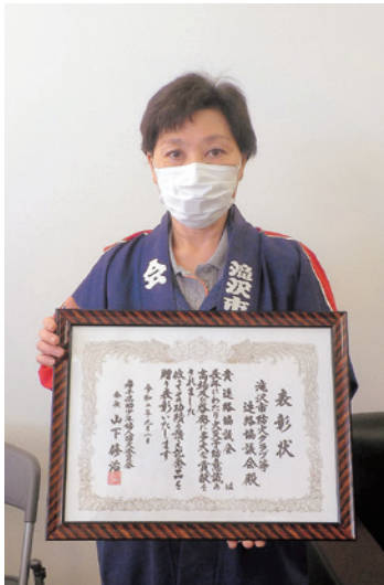
優良婦人消防協力隊 「滝沢市婦人防火クラブ等連絡協議会 (滝沢市)」