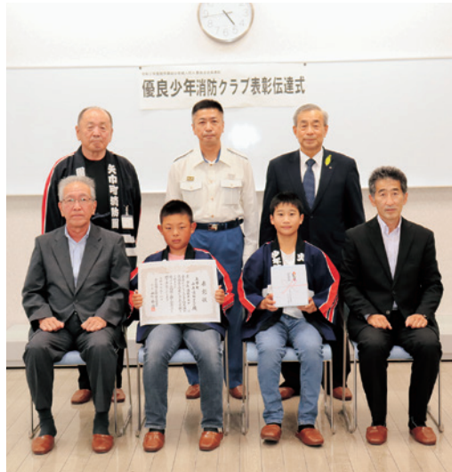
優良少年消防クラブ 「矢巾町少年消防クラブ (矢巾町)」